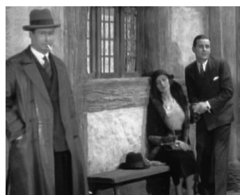
1931 THE SKIN GAME d'Alfred Hitchcock