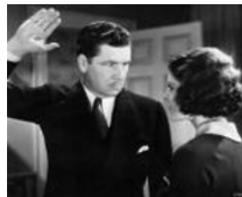
1931 LA FOLIE DES HOMMES (Rich Man's Folly) de John Cromwell avec Anne Shirley