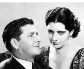
1930 SCANDAL SHEET de John Cromwell avec Kay Francis