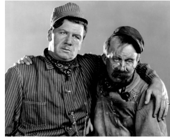
1927 AU BOUT DU QUAI (Tell it to Sweeney) de Gregory La Cava avec Chester Conklin