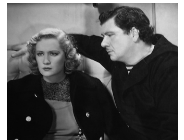
1932 LE MONDE ET LA CHAIR (World and the Flesh) de John Cromwell avec Miriam Hopkins