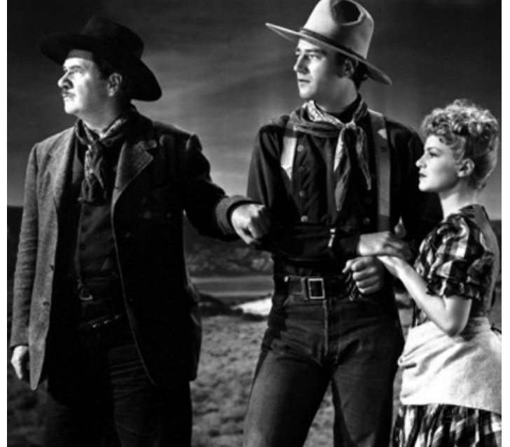
1939 LA CHEVAUCHÉE FANTASTIQUE (Stagecoach) de John Ford avec John Wayne, Claire Trevor