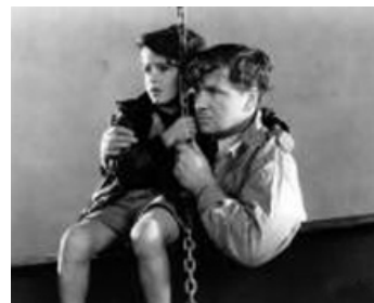
1930 LADIES LOVE BRUTES de Rowland V. Lee avec Mary Astor