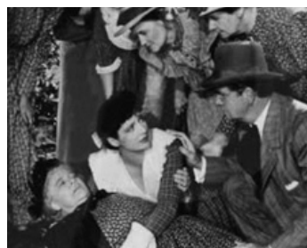
1940 LES DALTON ARRIVENT (When the Daltons rode) de G. Marshall avec Kay Francis