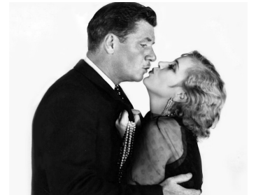
1929 LE LOUP DE WALL STREET (The Wolf of Wall Street) de R. V. Lee avec Olga Baclanova