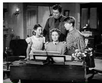
1939 LA JEUNESSE DE THOMAS EDISON (Young Edison) de N. Tauroug avec M. Rooney