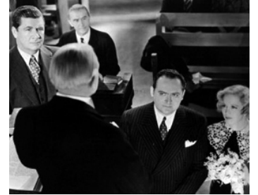
1936 DEUX FEMMES (John Meade's Women) de R. Wallace avec E. Arnold, Francine Larrimore