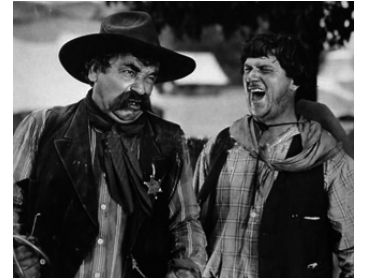
1927 THE ROUGH RIDERS de Victor Fleming avec Noah Beery