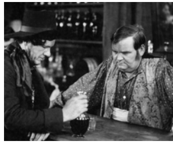
1925 LE PONY EXPRESS (The Pony Express) de James Cruze avec William Dyer