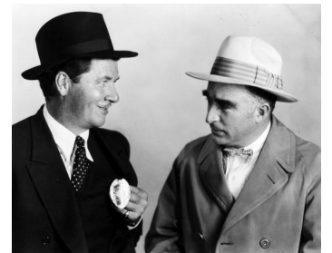
1928 LA RAFLE (The Dragnet) de Josef von Sternberg avec George Contreras