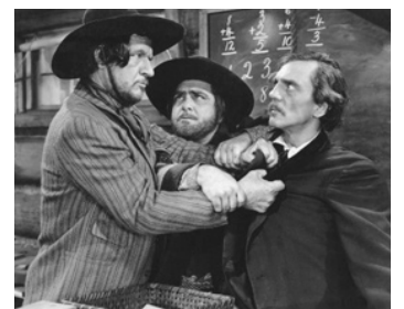
1940 LES TUNIQUES ÉCARLATES (North West Mountain Police) de Cecil B. De Mille