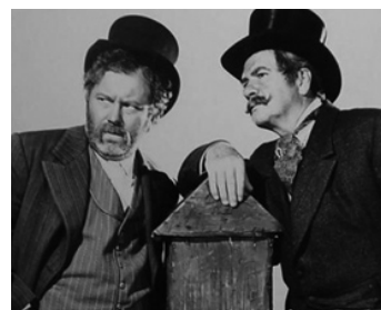
1941 TEXAS (Texas) de George Marshall avec Edgar Buchanan