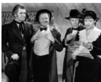
1940 LITTLE MEN de Norman Z. McLeod avec Jack Oakie, Kay Francis