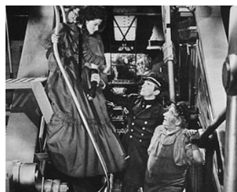
1939 LES MAÎTRES DE LA MER (Rulers of the Sea) de Fr. Lloyd avec M. Lockwood, D. Fairbanks Jr