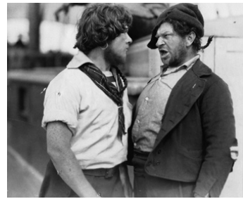
1926 VAINCRE OU MOURIR (Old Ironsides) de James Cruze avec Charles Farrell