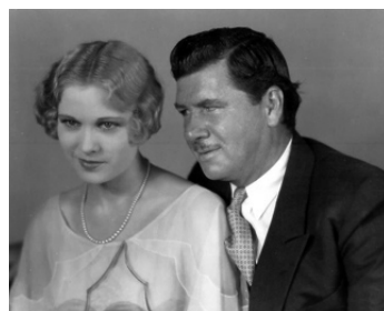
1929 FORCE (The Mighty) de John Cromwell avec Esther Ralston