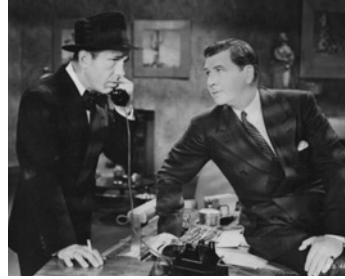
1938 LES ANGES AUX FIGURES SALES (Angels with dirty faces) de Michael Curtiz avec Humphrey Bogart