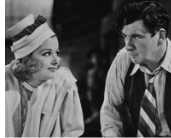
1936 BONNE BLAGUE (Wedding Present) de Richard Wallace avec Joan Bennett