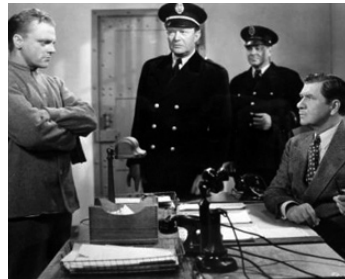
1938 À CHAQUE AUBE JE MEURS (Each Dawn I die) de William Keighley avec James Cagney