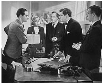
1937 UNE VIE NOUVELLE (Racketeers in Exile) de Erle Kenton avec Wynne Gibson, M. Lawrence