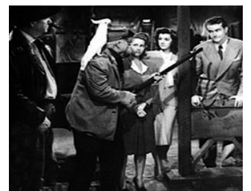
1942 L'AFFAIRE DU FORT DIXIE (Whistling in Dixie) de S. Simon avec Red Skelton