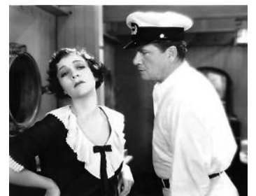
1930 DÉSEMPARÉ (Derelict) de Rowland V. Lee avec William Boyd