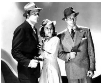
1939 AGENT DOUBLE (Espionage Agent) de Lloyd Bacon avec Brenda Marshall