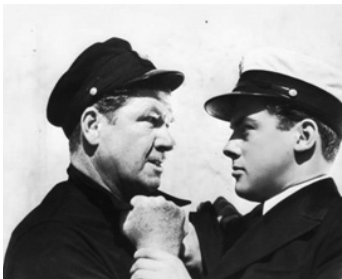
1938 PATROUILLE EN MER (Submarine Patrol) de John Ford avec Richard Greene