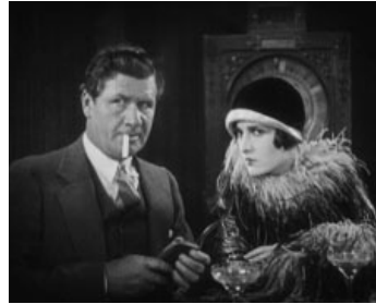
1927 LES NUITS DE CHICAGO (Underworld) de Josef von Sternberg avec Evelyn Brent