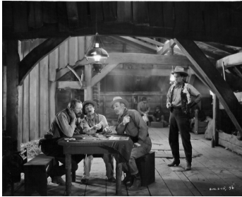
1927 LA TOISON D'OR (White Gold) de William K. Howard avec Clyde Cook