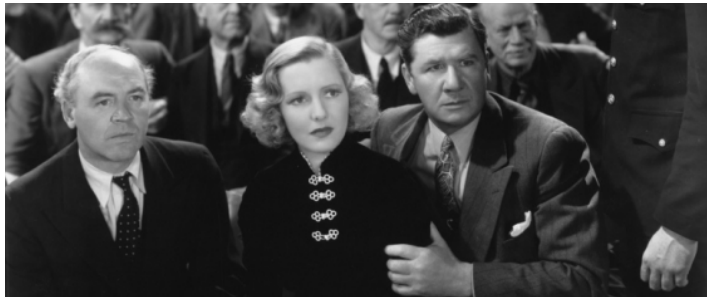
1936 L'EXTRAVAGANT MONSIEUR DEEDS (Mr Deeds goes to Town) de Frank Capra avec Jean Arthur