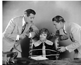
1928 TOO MANY CROOKS de Fred C. Newmeyer avec Mildred Davis, Lloyd Hughes